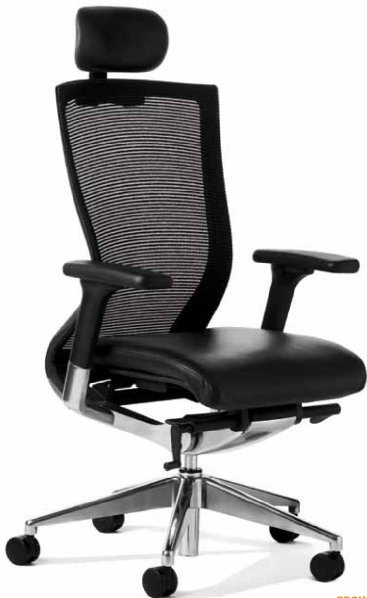
BEGIN + P

Kancelářská židle Begin splňují veškeré požadavky na moderní vybavení kanceláře. Je velmi dobře designově zhotovená při zachování pohodlí a ergonomie sezení.