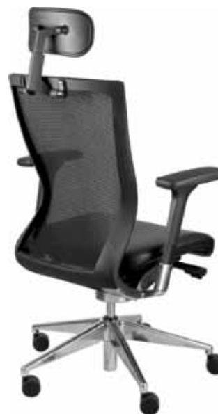
BEGIN + P